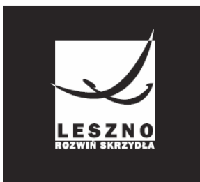
Logo na ciemnym tle