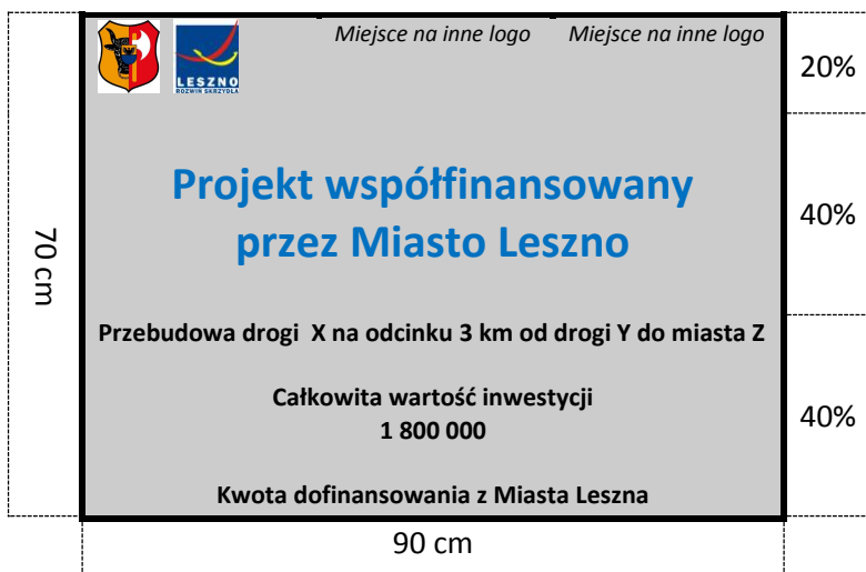
Wzór tablicy informacyjnej / pamiątkowej o wymiarach 90 x 70 cm

W przypadku zabytków umieszczanie tablic należy skonsultować z Wojewódzkim Urzędem Ochrony Zabytków / Delegatura w Lesznie.