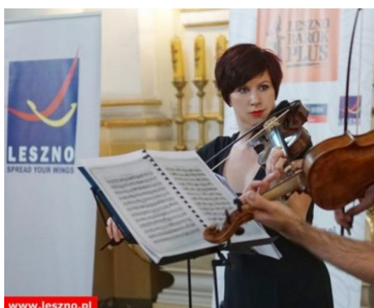
Przykładowe wykorzystanie bramy pneumatycznej i roll-up'u